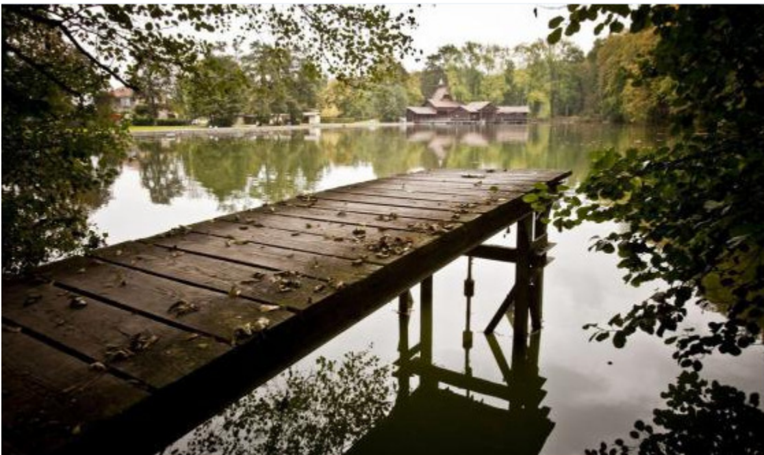
Dreiweihern, 9011 St. Gallen