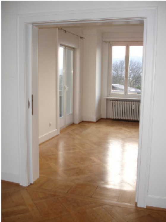
Parkettbrücke. Dolderstr. 40, 8032 Zürich