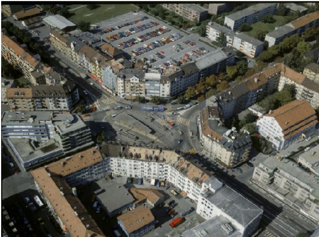
Albisriederplatz, 8003 Zürich