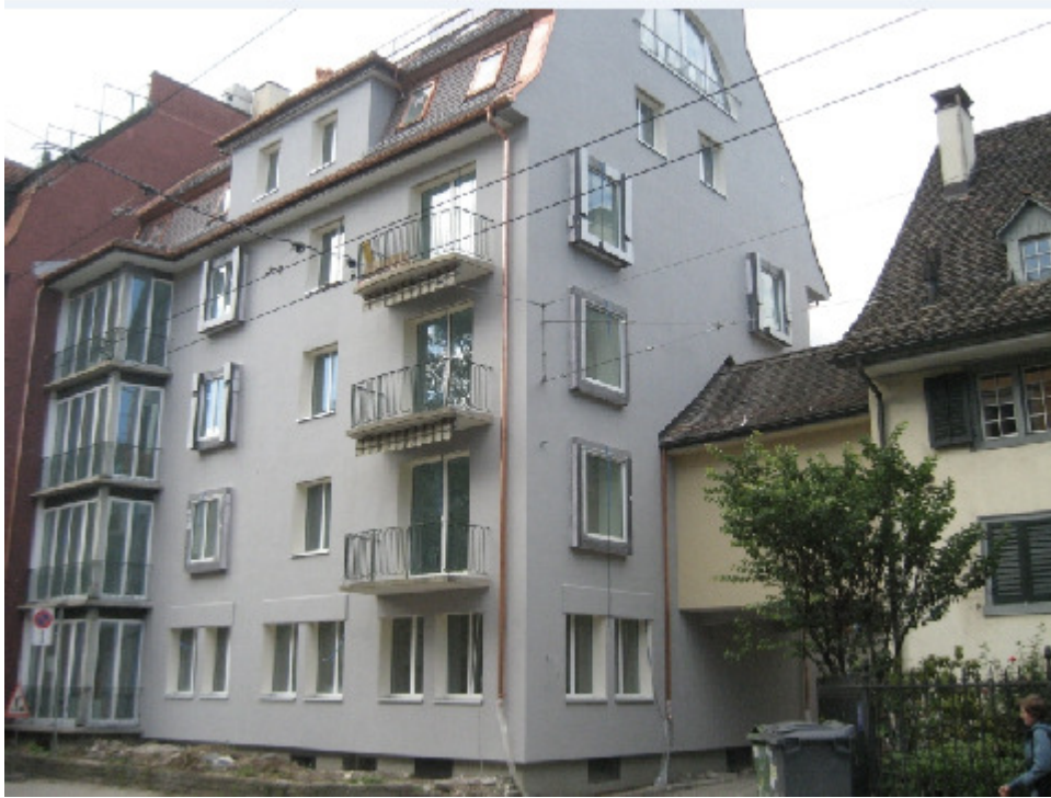
Zw. Höschgasse 83 u. 89, 8008 Zürich