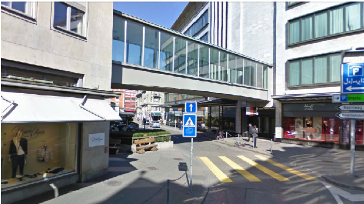
Jelmoli, Seidengasse 1, 8001 Zürich