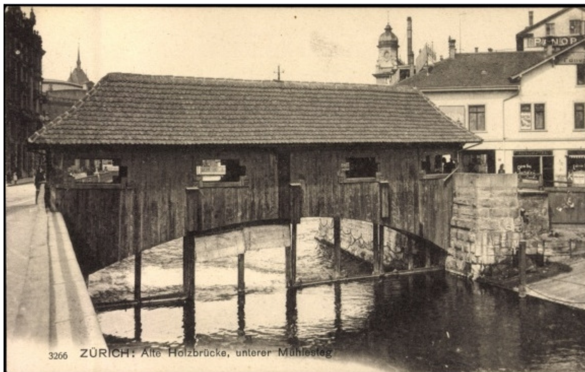
Unterer Mühlesteig, 8001 Zürich (1689-1950)